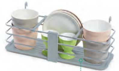
Module à suspendre