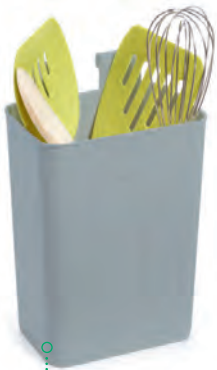
Porte-ustensiles de cuisine