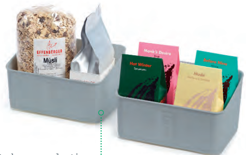
Petits bacs en plastique