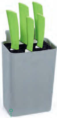
Bloc à couteaux à lamelles en plastique