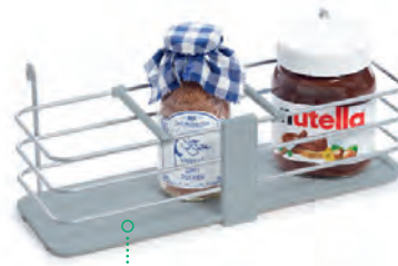
Module à suspendre